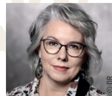
Jacline MOURAUD Psychothérapeute, militante politique et figure du mouvement des gilets jaunes